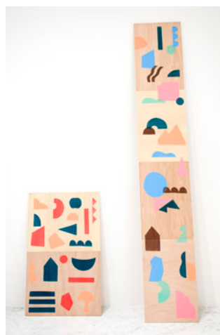
The deformation process

主な展覧会歴は、「SOSEKI展」(世田谷ものづくり学校、2009年)、「奥の奥の山はみずいる朝の味展」(omoh gallery、2009年)、「jun-gin collection2009」(ふくい南青山291、2009年～)、「winter room展」(mono gallery、2010年)、「Tokyo Made Market」(mememachinegallery、2010年)、「Vernissage2011」(HAPPA、2011年)など。